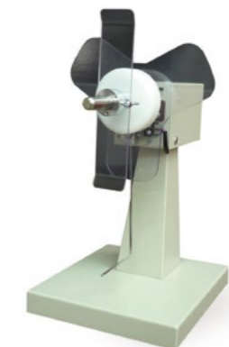
ワインダー UR110 III スタンドアロン型