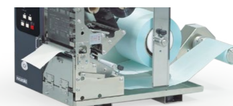
剥離ユニット (※写真は開発中のものです)