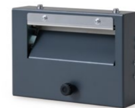
カッターユニット C-400X