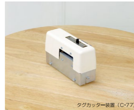
タグカッター装置 (C-77)

●本カタログに掲載の製品は改良のため、内容・仕様を予告なく変更することがあります。